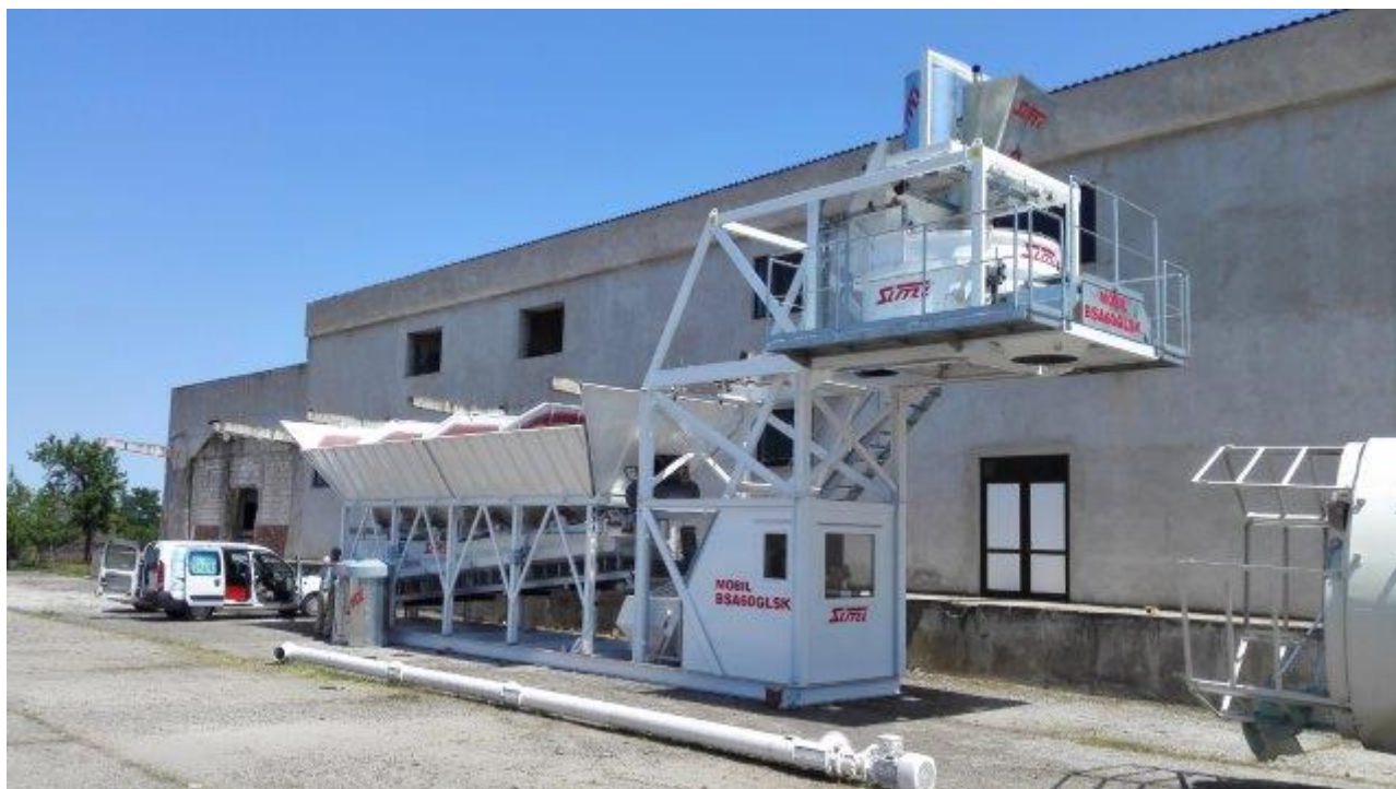
Poza cu titlu orientativ

Statia se transporta cu 2 semiremorci standard de 13,60m.