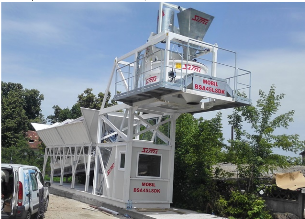
Poza cu titlu orientativ

Statia se transporta cu 2 semiremorci standard de 13,60m.