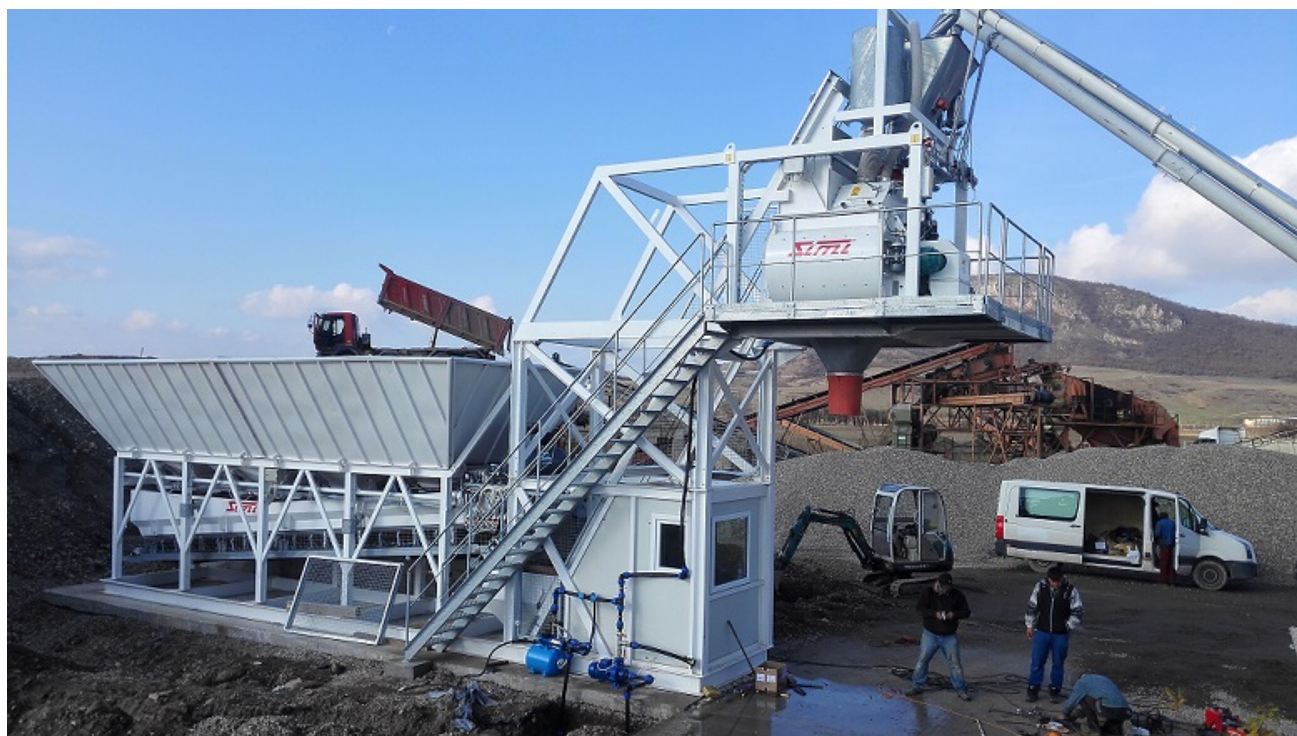
Poza cu titlu orientativ