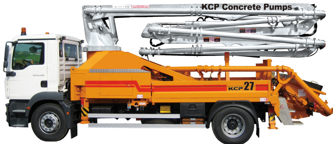
Poza cu titlu orientativ

Pompa de beton KCP 27Z120 cu brat in 4 elemente deschidere in Z, de 27m, montata pe autosasiu, noua.