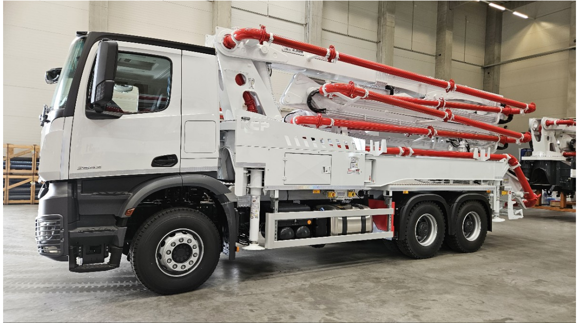
Poza cu titlu orientativ

Pompa de beton KCP 37ZX5150 cu brat in 5 elemente deschidere in Z, de 37m, montata pe autosasiu, noua.