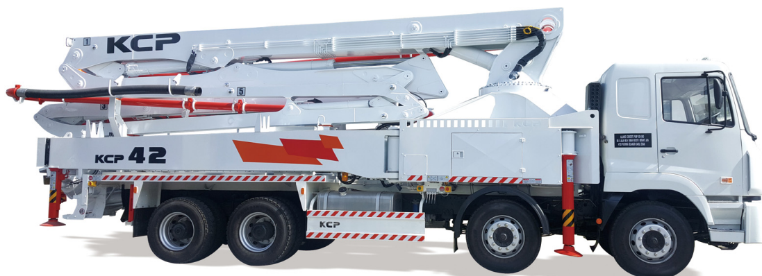
Poza cu titlu orientativ

Pompa de beton KCP43ZX5170 cu brat in 5 elemente deschidere in Z, de 43m, montata pe autosasiu, noua.