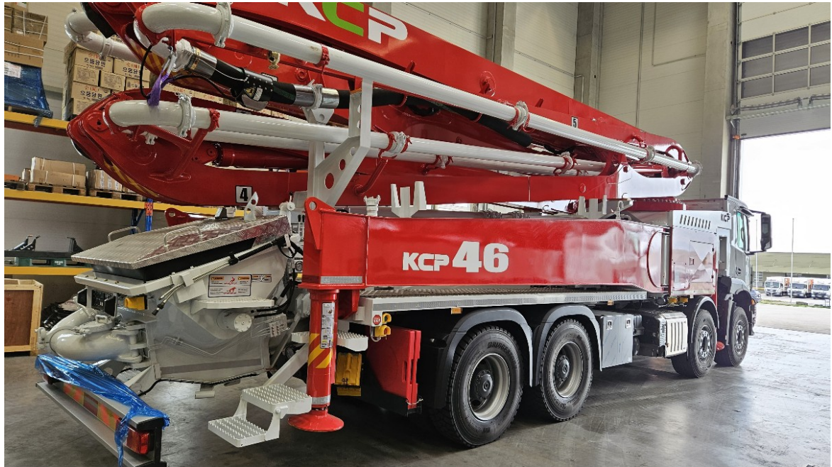
Poza cu titlu orientativ

Pompa de beton KCP46ZX5170 cu brat in 5 elemente deschidere in Z, de 46m, montata pe autosasiu, noua.