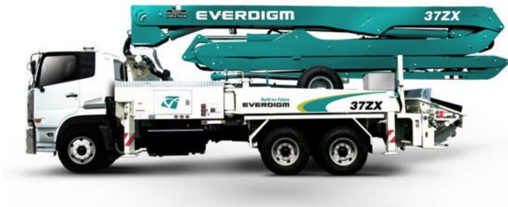
Poza cu titlu orientativ

Pompa de beton Hyundai Everdigm ECP37ZX cu brat in 4 elemente deschidere in Z, de 37m, noua, montata pe autosasiu nou.