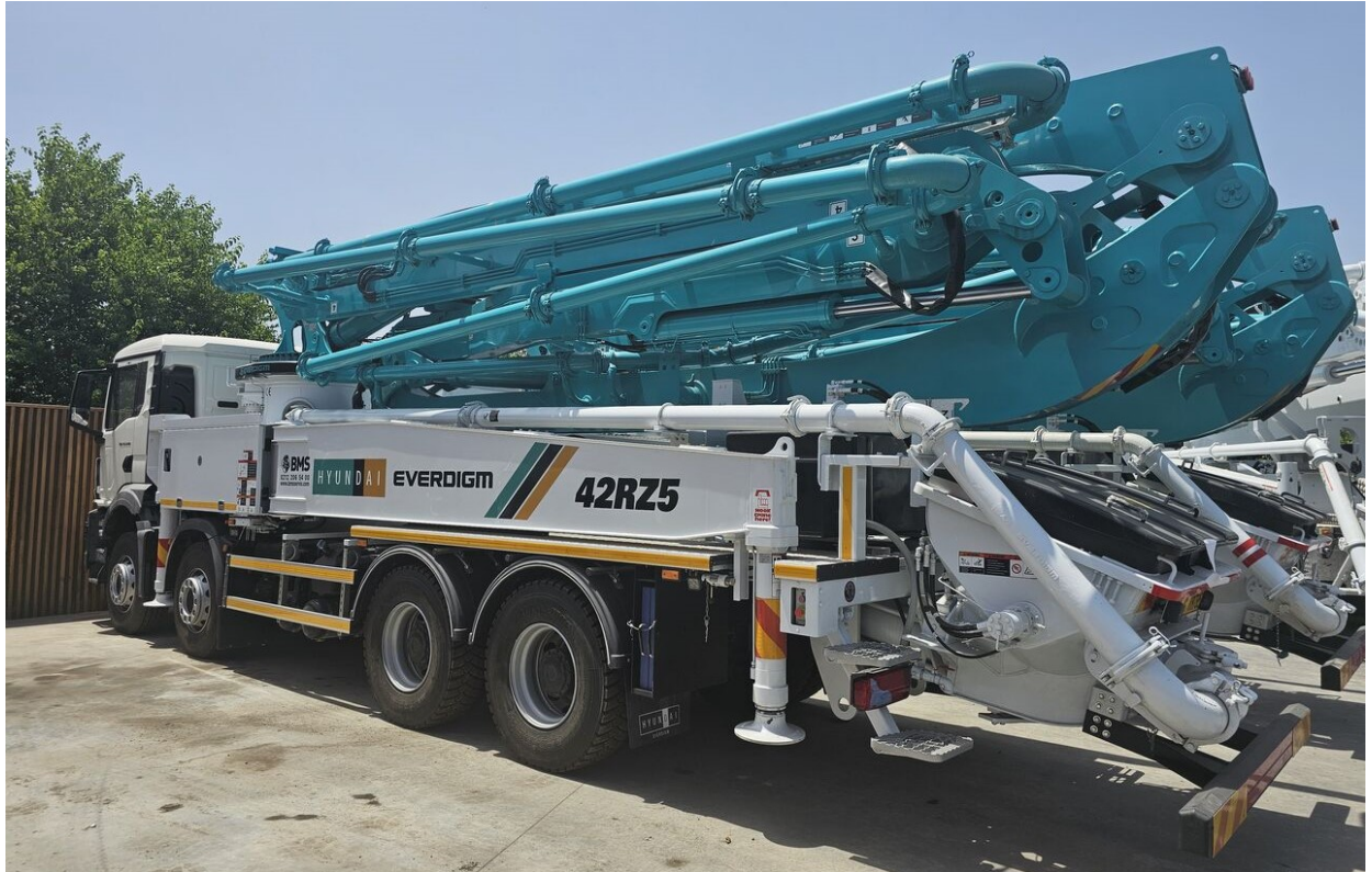
Poza cu titlu orientativ

Pompa de beton Hyundai Everdigm ECP42RZ cu brat in 5 elemente deschidere in RZ, de 42m, noua.