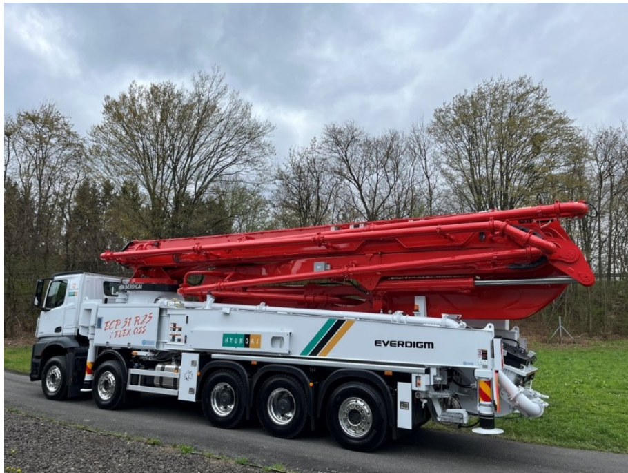
Poza cu titlu orientativ

Pompa de beton Hyundai Everdigm ECP51RZ cu brat in 5 elemente deschidere in RZ, de 51m, noua.